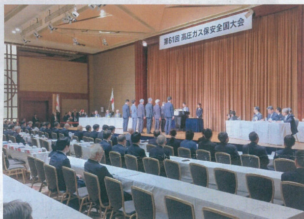
優良販売業者7者（経済産業大臣表彰）への表彰状授与の様子